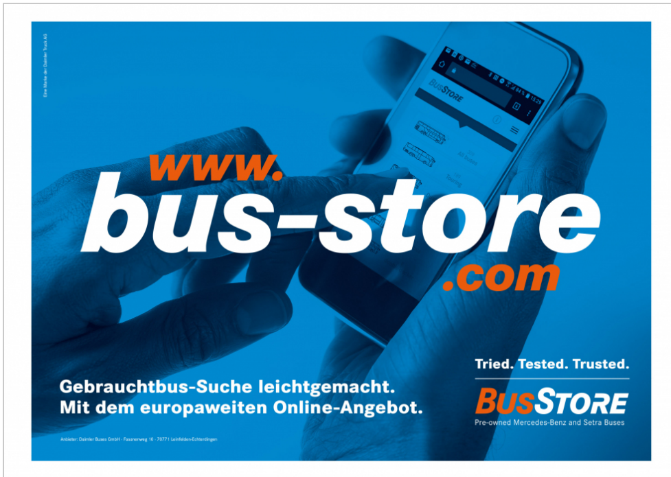
Verwendung des Markenzeichens auf großformatigen Plakaten