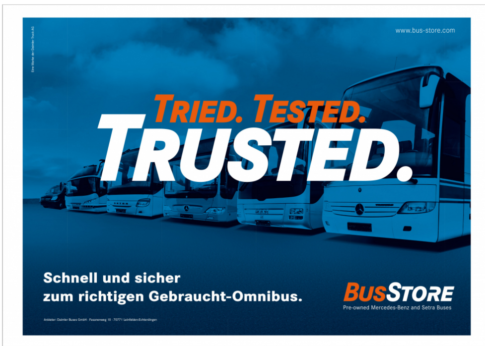
Verwendung des Markenzeichens auf großformatigen Plakaten