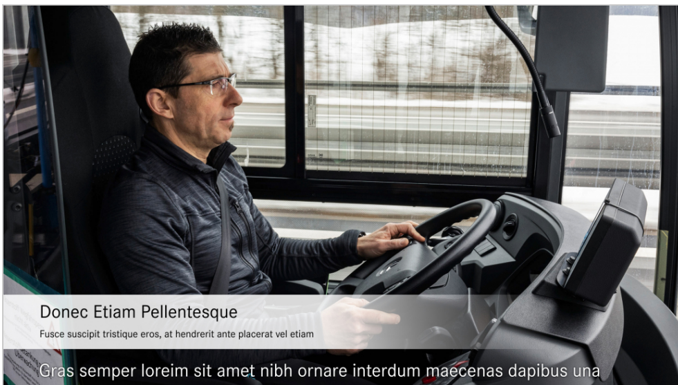
Donec Etiam Pellentesque Fusce suscipit tristique eros, at hendrerit ante placerat vel etiam