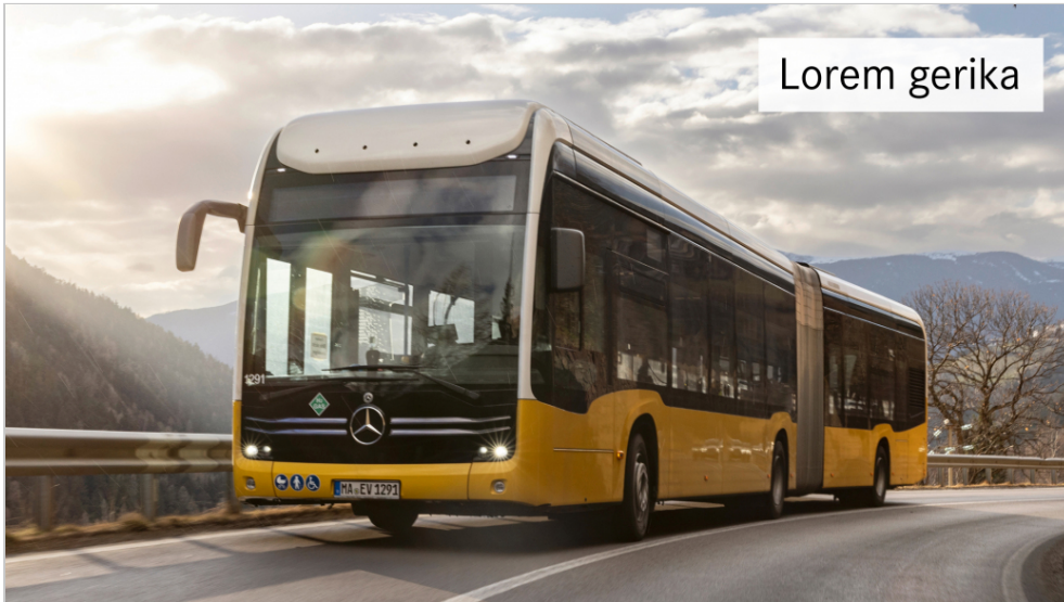
Kernbotschaft eines Films oder Videos auf einem Textinsert

Deckkraft angelegt. Alle Texte werden linksbündig und mit der Hausschrift Daimler CS in der Stärke Regular gesetzt. Einzeiliger Text auf Textinserts wird in 170 px, zweizeiliger Text in 110 px wiedergegeben (Videoformat UHD 3840 x 2160 Pixel). Der Zeilenabstand entspricht 120% der Schriftgröße, der Abstand zum Rand ist 1/2 x Höhe des Buchstabens „T“.