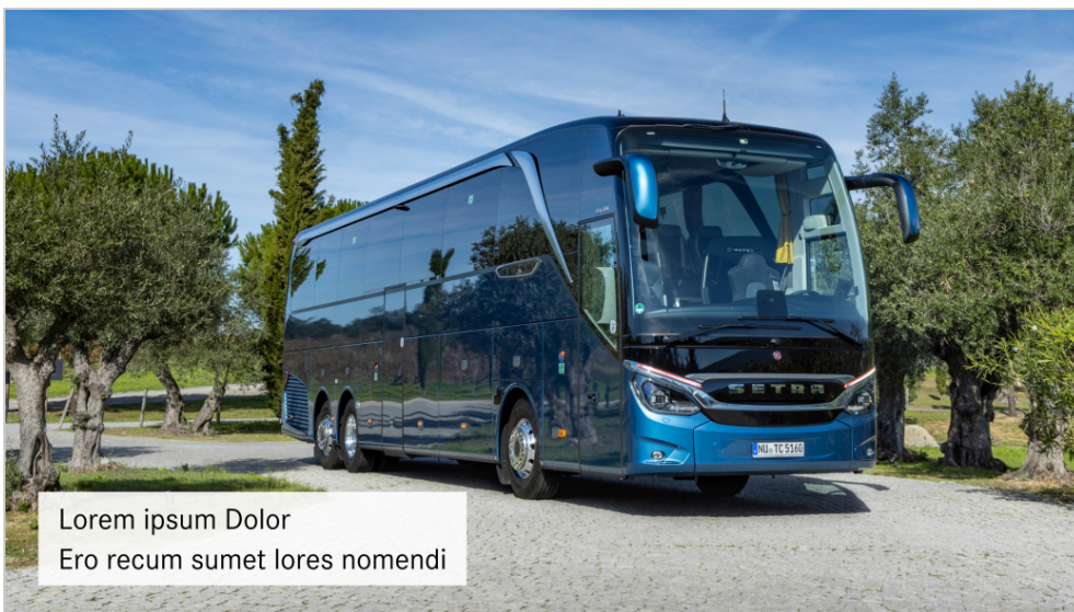
Textinsert auf weißer Hintergrundfläche mit 90% Deckkraft