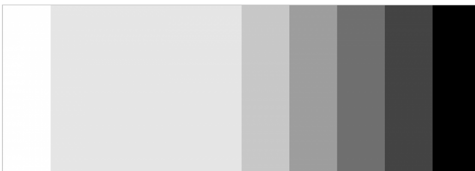
Light Grey mit Abdunkelungen

Ein auf wenige Farben reduziertes Farbsystem prägt das Erscheinungsbild und sorgt für einen konsistenten visuellen Markenauftritt. Die Leitfarbe von Daimler Truck ist Weiß, die großflächig eingesetzt wird und mit dem Unternehmenszeichen in Schwarz kontrastiert. Fließtexte werden grundsätzlich in Schwarz gesetzt.